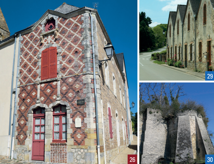
26. La maison Faucheux / 29. Les maisons ouvrières / 30. Les Fours à chaux

Il s'est aussi appliqué à magnifier le petit patrimoine, telle la fontaine 25 au pied du mur soutenant le jardin de la mairie. La maison Faucheux 26 montre, quant à elle, une variante de ce style, associant l'usage du tuffeau à celui de la brique. Mais ce dernier matériau, si important à la fin du 19 e siècle, est employé en exclusivité dans l'ancienne buanderie 27, exemple rare d'annexe bien conservée.