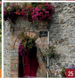
4. L'auberge de la Croix-Blanche / 8. Peinture de l'Église Saint Pierre / 8 L'Église Saint Pierre